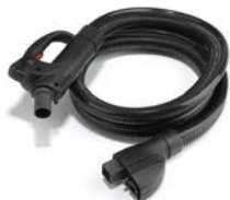
FLESS.ASP+VAP CON GRILLETTO L.3 MT + DET STEAM&VACUUM HOSE 3MT