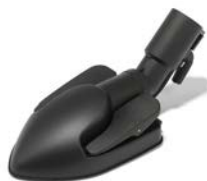
SPAZZOLA TRIANGOLARE TRIANGULAR BRUSH