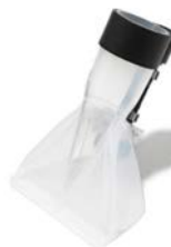
BOCCHETTA AV TRASPARENTE mm100 TRANSPARENT NOZZLE