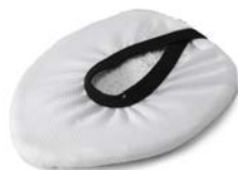
CALZINO PER SPAZZOLA TRIANGOLARE CLOTH FOR TRIANGULAR BRUSH