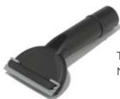
BOCCHET TA INGLNERA+GOMMINO SUCTION NOZZLE WITH SQUEEGEE