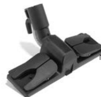
SPAZZOLA MULTIUSO MULTIPURPOSE BRUSH