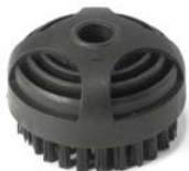
SPAZZOLINO D.65 SETOLE POLIESTERE Ø65 POLYESTER BRUSH