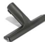
PULIVETRO VAPORE GLASS CLEANER