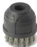
SPAZZOLINO D.40 SETOLE INOX Ø40 STAINLESS STEEL BRUSH