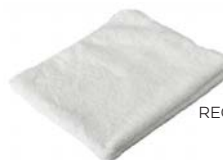
PANNO RETTANG. BIANCO MICROFIB. RECTANGULAR CLOTH