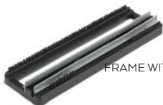
TELAIO SETOLATO CON RACLE IN GOMMA FRAME WITH BRISTLES AND SQUEEGEE FOR MULTIPURPOSE BRUSH