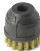
SPAZZOLINO D.40 SETOLE OTTONE Ø40 BRASS BRUSH