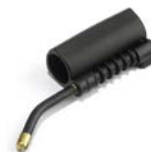
GRUPPO LANCIA A- V PRO INOX 138 LANCE PRO INOX 138